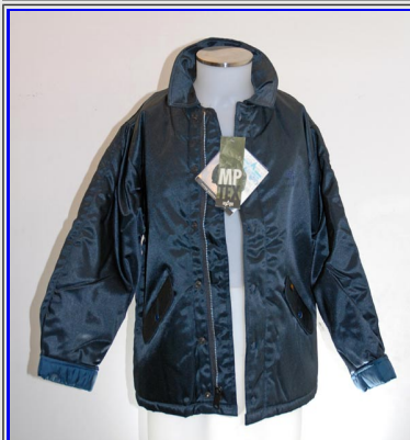
WI/96 MP Tex Made in USA